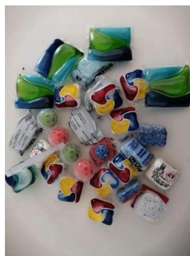
Ukázka nebezpečných předmětů k aktivitě č. 3