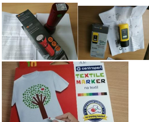
Pomůcky k aktivitě č.1