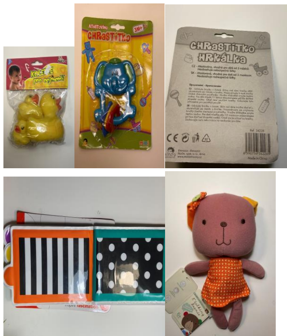
Ukázka hraček pro nejmenší k aktivitě č. 4

Projekt „Efektivní podpora zdraví osob ohrožených chudobou a sociálním vyloučením“, registrační číslo CZ.03.2.63/0.0/0.0/15_039/0009439, podpořený z OP Zaměstnanost ESF a státního rozpočtu ČR