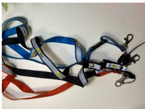
Ukázka nebezpečných předmětů k aktivitě č. 3